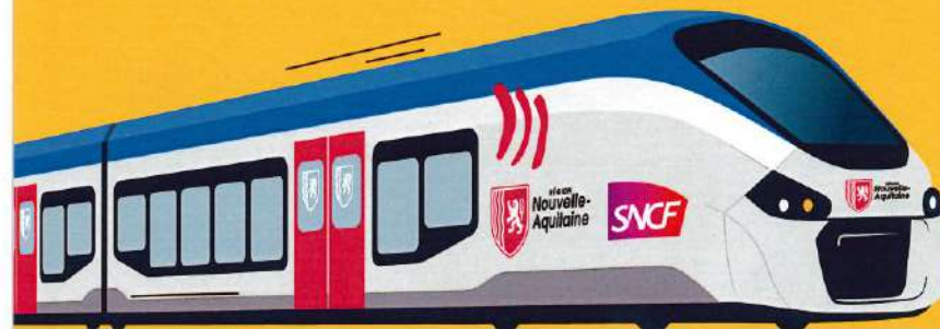
Illustration TER : Composit'it - Conception : vitamime@- 05/26 * En vente sur ter.sncf.com/nouvelle-aquitaine. Offre valable jusqu'au 31/08/2026

Toutes les infos sur transports.nouvelle-aquitaine.fr